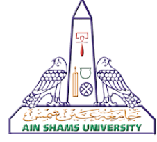
جامعة عين شمس