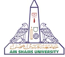
جامعة عين شمس